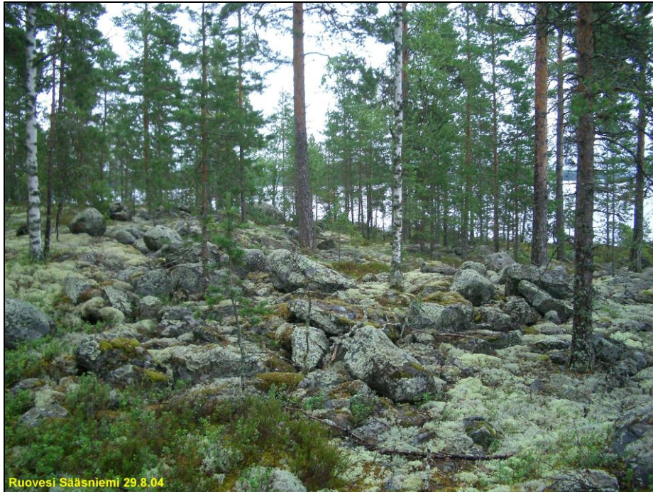
Koilliskärjen etelärannan kivien peittämää rantakalliota.

Niemen koilliseen kurottuvan osan rannat ovat loivia, pohjoisranta soinen, maaperä nousee vasta kauempana rannasta. Niemen alue puolivälistä taitteeseen ja koilliskärkeen on hakattu ja laikutettu. Paikoin laikut (eteläosassa) ovat umpeen kasvaneita, mutta koillisosassa avoimia. Tarkastin alueen huolellisesti. Maaperä on kivistä ja märkää moreenia, mutta paikoin rantahiekkaista ja vähäkivisempää, ylempänä hiekkaista moreenia. Havaintomahdollisuudet inventoinnissa olivat siten kohtuullisen hyvät. Rantakalliot ovat laakeita ja loivia, kivikkoisia. Alueen rannat eivät ole tyypillistä lapinrauniomaastoa, joskin eräsijan kiukaat voivat sijaita tämänkin kaltaisessa maastossa. Niitä ei nyt havaittu ja laikutus (joka ei ulottunut aivan rantaan) lienee hävittänyt mahdolliset pienet kivirauniot jos sellaisia alueella olisi kauempana rannasta ollut.