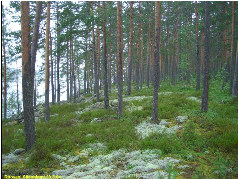
Ruovesi Sääsniemi 29.8.04

Niemen tyven lounaisosa oli suurimmaksi osaksi hakattu ja laikutettu. Tarkastin alueen huolellisesti havaitsematta mitään esihistoriaan viittaavaa. Niemen lounaisranta on kivistä ja karua mäntymetsää, maaperä on ohuehko ja hyvin kivinen, paksuturpeinen. Kymmenkunnassa vaivoin kivien väliin, paksun turpeen alle koverretussa koekuopassa en havainnut mitään esihistoriaan viittaavaa.