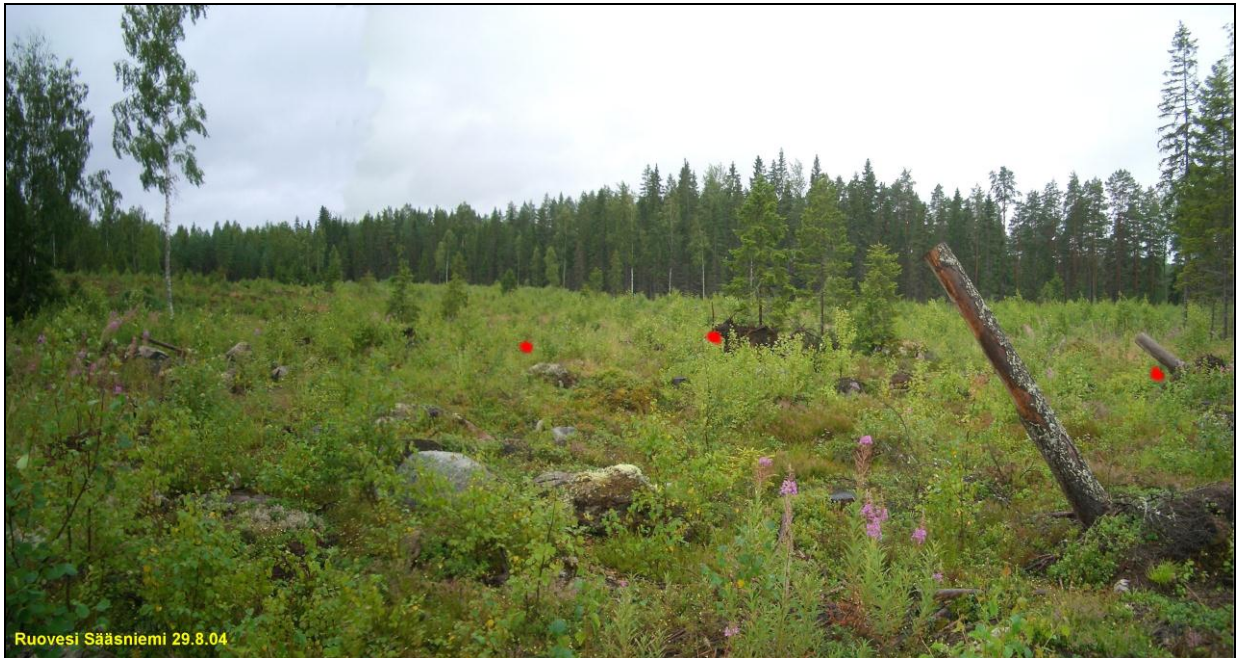
Asuinpaikkaa koko kuvan etualalla. löytöpaikat merkitty punaisella täplällä. Kuvattu lounaaseen.