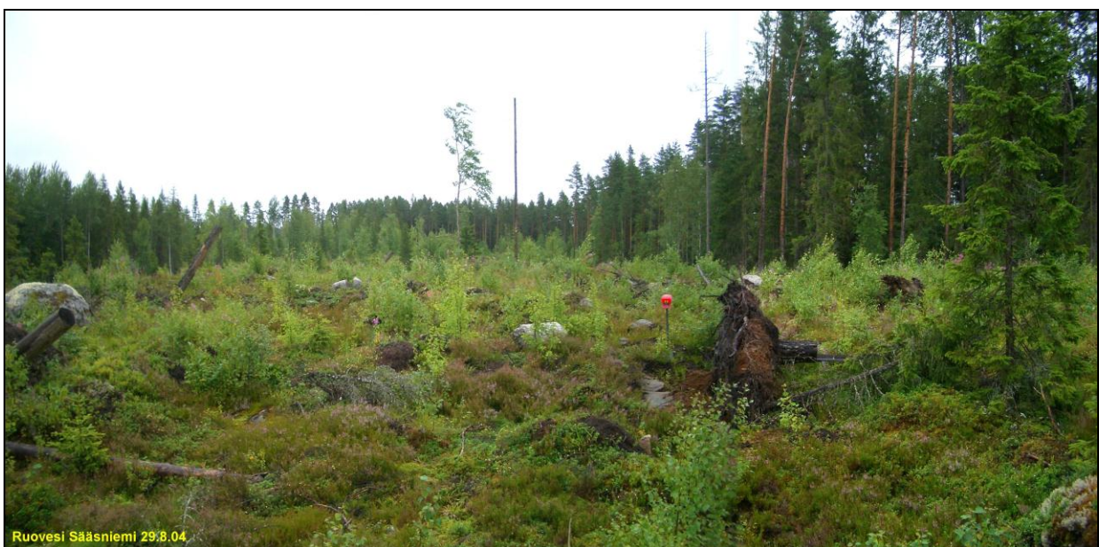
Asuinpaikkaa kuvattuna koilliseen sen lounaisreunalta törmän ääreltä. Tuulenskaato, josta enimmäkseen löydöt on kuvan keskellä oikealla (punainen hattu lapion varren päässä). Löytöjä myös aivan kuvan vas. laidalta, sekä kuvan oikean laidan ulkopuolelta.